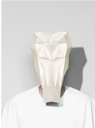
Lisette Appeldorn, Maske, Sperrholz. Mask, plywood. Ca. 40 × 30 × 18 cm.