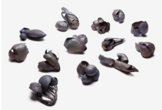
Jiun-You Ou, Objekte Individual Mythologies, 2011–2013, Bronze, Kupfer, abgesenkt, geschmiedet, patiniert. Objects, brass, copper, sinking, hand fabricated, patina.