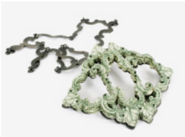
Lauren Tickle, Halsschmuck $46.00 Pendant, 2013. Dollarscheine, Silber, Latex, Monofilament. Necklace. Dollar bills, silver, latex, monofilament. 1 × 9 × 31 cm.